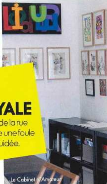
Le Cabinet d'Amateur

■ Tél. : 01 43 48 14 06. www.lecabinetdamateur.com