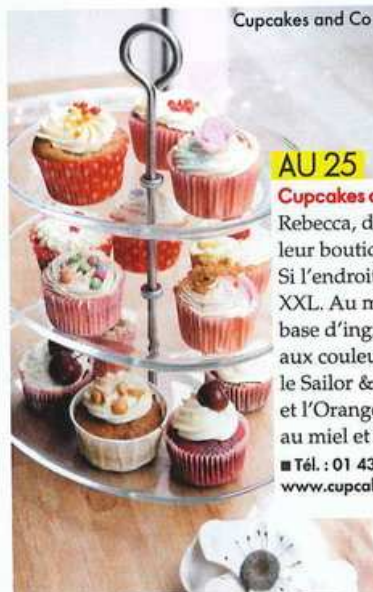
Cupcakes and Co